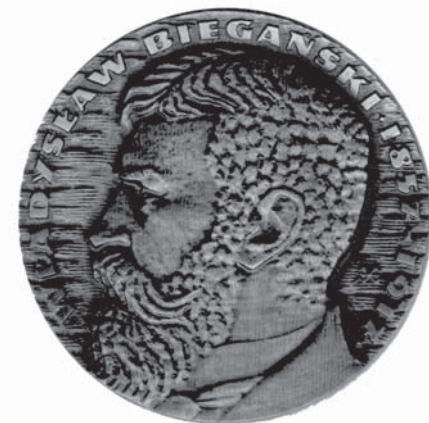
Władysław Biegański. Medal wybity przez Częstochowskie Towarzystwo Lekarskie (awers i rewers)